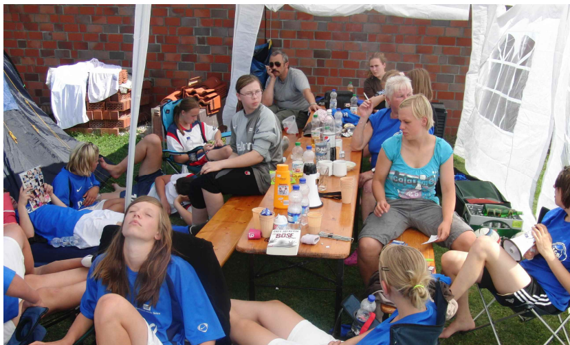
Die B- und C-Juniorinnen nach der Siegerehrung

Das ging leider verloren, und somit belegten wir den zweiten Platz des Turniers.