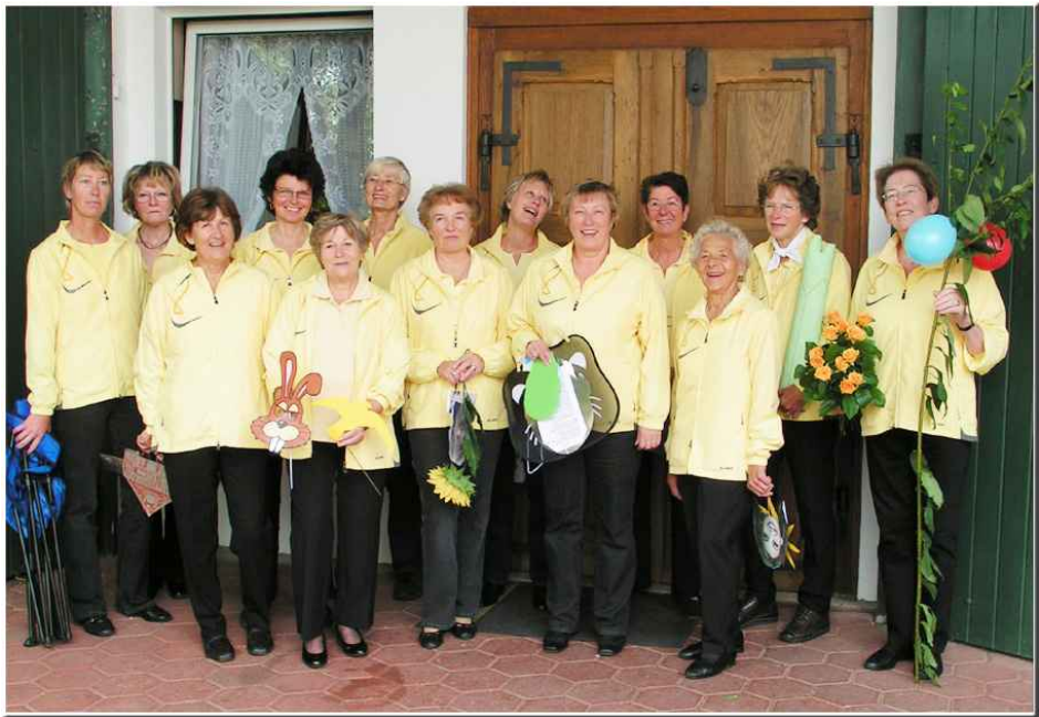
Die Damen der Gymnastikabteilung in ihrem neuen Outfit vor dem "Weinfäßchen"