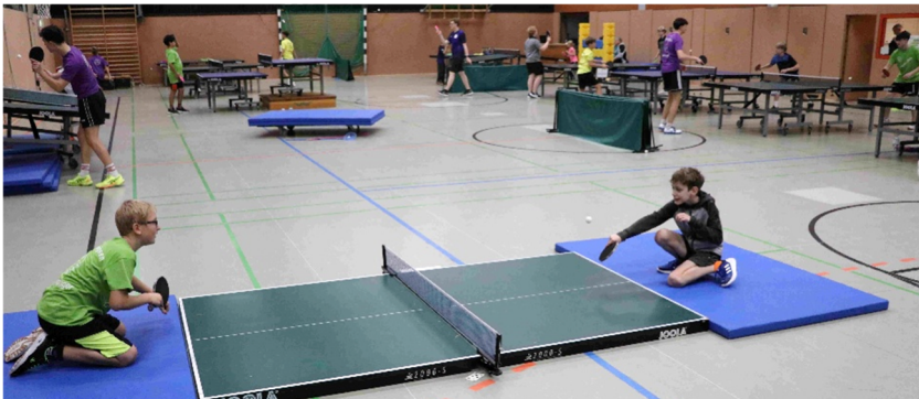
Wäre doch mal was für alte Herren: der Boden-Tisch.

Einer der Abende ist stets für ein anderes Turnier reserviert – mittlerweile hat das Kultra-Multra-Turnier einen festen Platz im Wochenplan. Wir stellen verschiedene Tische mit verschiedenen Regeln auf: ob Graben-Tisch, Kurven-Tisch, Berg-Tisch oder Federballschläger-Tisch. Jede Station bietet andere Herausforderungen.