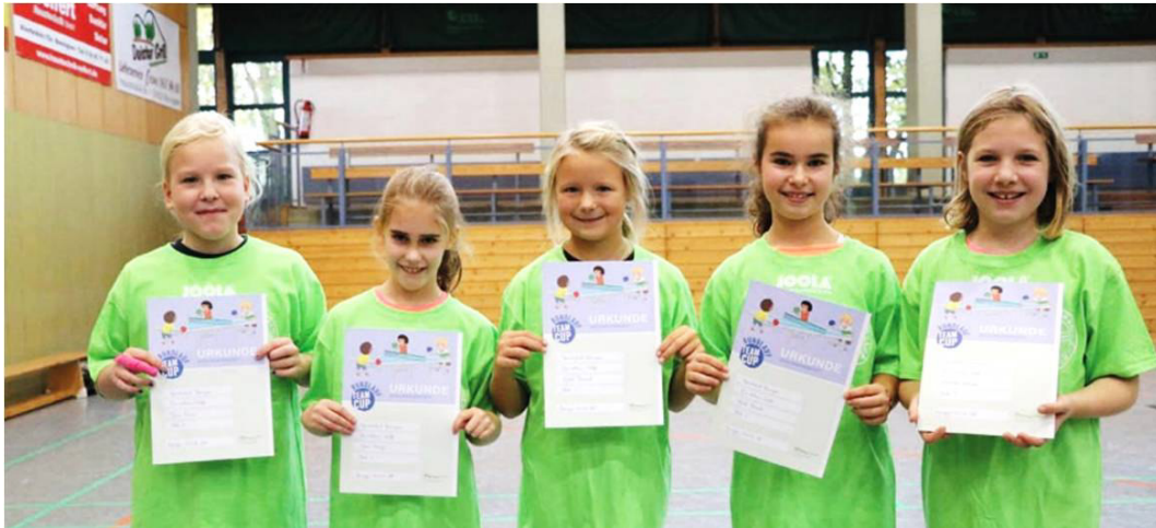
„Die schlauen Wölfe“ sind die Sieger der 4. Klasse.

Die Klassenlehrerinnen waren sicher froh, dass sich die Schüler diesen Vormittag einmal gänzlich bei uns austoben konnten. Mit der nötigen Geduld waren die Neugierde und das Interesse der Kinder aber sehr bereichernd.