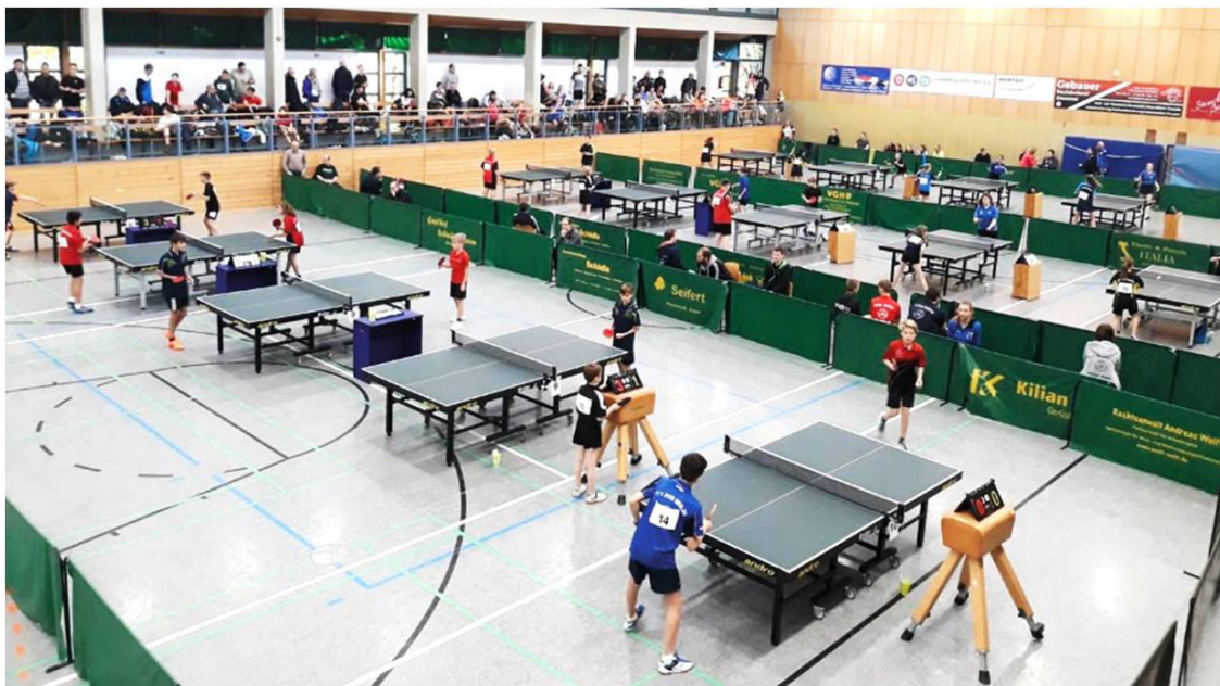
Eine gut besuchte Halle und voller Einsatz an 20 Tischen bei der BM

Recht kurzfristig musste der Bezirksverband einen neuen Standort suchen – und fand mit unserer Halle in Bennisgen damit eine für beide Seiten zufriedenstellende Lösung. Unsere Spieler freute es natürlich umso mehr.