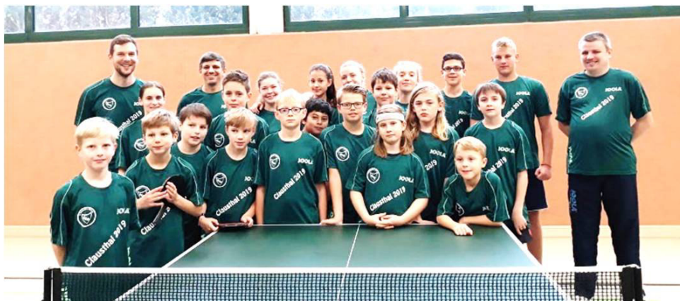
Orange nur noch im Hintergrund. Grün ist die Farbe der Saison.

Die extra bestellten Trikots für unser Trainingslager schaffen neben unseren gemeinsamen Einheiten einen tollen Zusammenhalt und machen optisch stets etwas her.