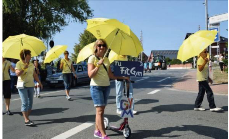
Unsere Fit-Gym Damen beim Umzug

Vom 31. August bis 1. September feierten wir bekanntlich das 100-jährige Bestehen unseres Vereins. An dem langen Festumzug durch unser Dorf, bei wunderschönem aber zu warmem Wetter, nahmen alle Abteilungen des FCB, und damit auch unsere Fit-Gym-Damen teil. Der Weg führte uns vom alten zum neuen Sportplatz an der Grundschule und war bei der Hitze nicht einfach zurückzulegen. Zum Glück wurden von den begeisterten Zuschauern immer wieder erfrischende Getränke in den Zug gereicht.